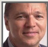
Alain Dubuc Économiste